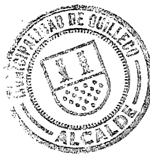
RODRIGO TAPIA AVELLO ALCALDE DE QUILLECO