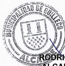
RODRIGO TAPIA AVELLO ALCALDE DE QUILLECO