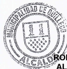
RODRIGO TAPIA AVELLO ALCALDE DE QUILLECO