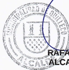
RAFAEL CONCHA MOREIRA ALCALDE DE QUILLECO(S)