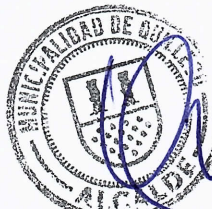
JAIME QUILODRAN ACUÑA ALCALDE DE QUILLECO