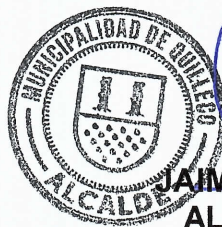
JAIMÉ QUILODRAN ACUÑA ALCALDE DE QUILLECO