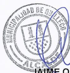
JAIME QUILODRÁN ACUÑA ALCALDE DE QUILLECO