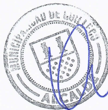
JAIME QUILODRÁN ACUÑA ALCALDE DE QUILLECO