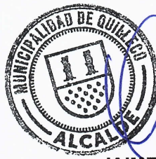
JAIME QUILODRAN ACUNA ALCALDE DE QUILLECO