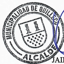
JAIME QUILODRAN ACUÑA ALCALDE DE QUILLECO