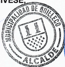
JAIME QUILODRAN ACUNA ALCALDE DE QUILLECO