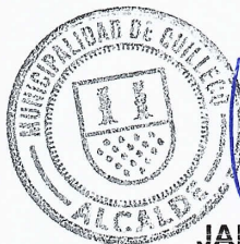
JAIME QUILODRAN ACUÑA ALCALDE DE QUILLECO