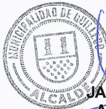
JAIME QUILODRAN ACUÑA ALCALDE DE QUILLECO