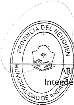
Ariel Aravena ARIEL ARAVENA Intendente de Andacollo