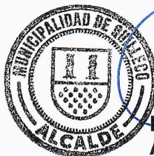
RAFAEL CONCHA MOREIRA ALCALDE DE QUILLECO (S)