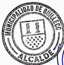
JAIME QUILODRAN ACUÑA ALCALDE DE QUILLECO