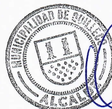
JAIME QUILODRAN ACUÑA ALCALDE DE QUILLECO