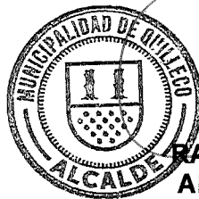
RAFAEL CONCHA MOREIRA ALCALDE DE QUILLECO (S)