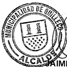
JAIME QUILODRAN AGUÑA ALCALDE DE QUILLECO