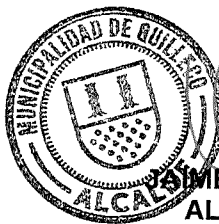
JAI ME QUILODRAN ACUÑA ALCALDE DE QUILLECO