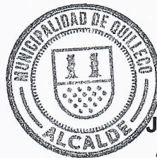
JAIME QUILODRAN ACUÑA ALCALDE DE QUILLECO