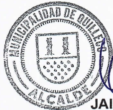
JAIME QUILODRAN AGUÑA ALCALDE DE QUILLECO