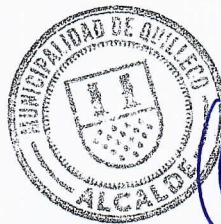
JAIME QUILODRAN ACUÑA ALCALDE DE QUILLECO