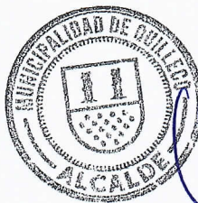
JAIME QUILODRAN ACUÑA ALCALDE DE QUILLECO