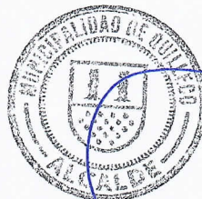
RAFAEL CONCHA MOREIRA ALCALDE DE QUILLECO(S)