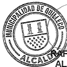
RAFAEL CONCHA MOREIRA ALCALDE DE QUILLECO(S)