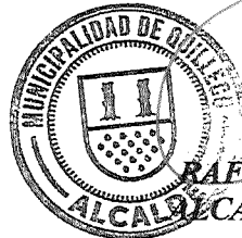
RAFAEL CONCHA MOREIRA ALCALDE DE QUILLECO(S)