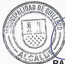
RAFAEL CONCHA MOREIRA ALCALDE DE QUILLECO(S)