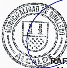
RAFAEL CONCHA MOREIRA ALCALDE DE QUILLECO (S)