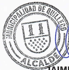
JAIME QUILODRAN ACUÑA ALCALDE DE QUILLECO