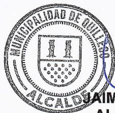
JAIIME QUILODRAN ACUÑA ALCALDE DE QUILLECO