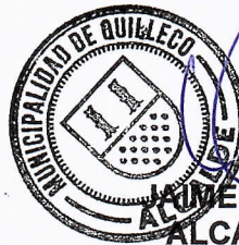
JAI ME QUILODRAN ACUÑA ALCALDE DE QUILLECO