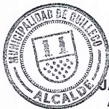
JAIME QUILODRAN ACUÑA ALCALDE DE QUILLECO