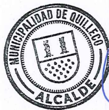
JAIME QUILODRAN ACUÑA ALCALDE DE QUILLECO