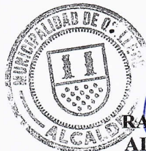
RAFAEL CONCHA MOREIRA ALCALDE DE QUILLECO (S)