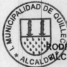
RODRIGO TAPIA AVELLO ALCALDE DE QUILLECO